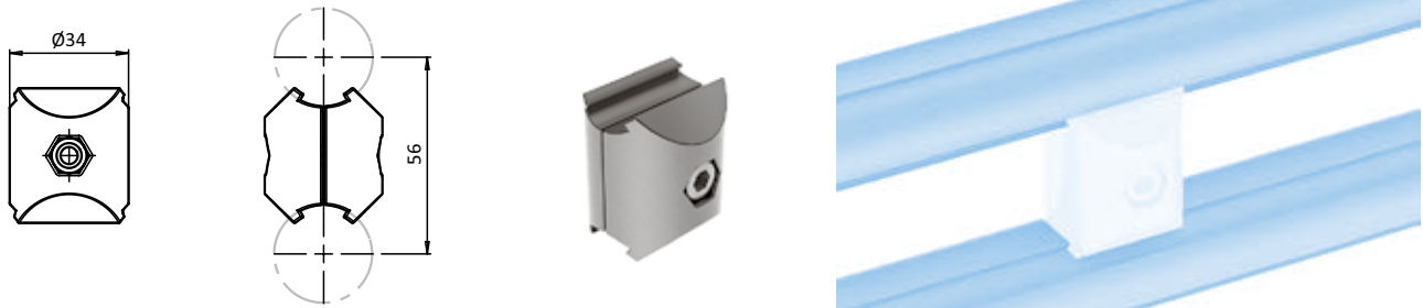
Set Parallelverbinder D28 Set Parallel Connector D28