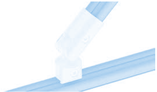
Set Kugelverbinder D28 Set Ball Connector D28