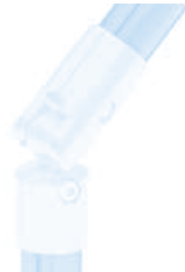
Kugel-Stoßverbinder D28 (Set) Ball Butt Connector D28 (Set)