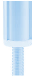
Set Gewindehülse D28 Threaded Sleeve D28