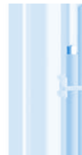
Universal-Kabelbinderblock Universal Cable Binding Block