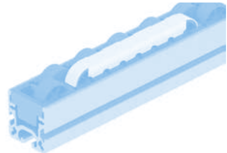
Bremse H26 Brake H26