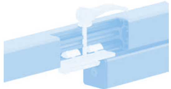
Profilgleiter ZN 40 × 80 (Set) Profile Slider ZN 40 × 80 (Set)