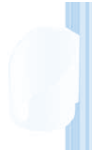
Becherhalter Cup Holder