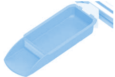
Schwenkadapter für Behälter Pivoting Adapter for containers