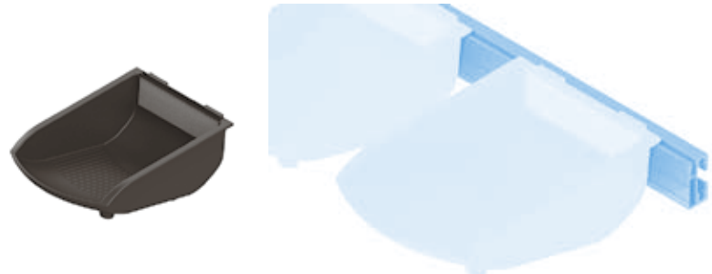
Greifschale 105 × 130 × 50 (Set) Grab Tray 105 × 130 × 50 (Set)