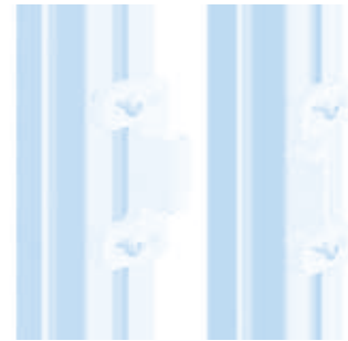
Doppelkugelschnäpper PA Double Ball Catch PA