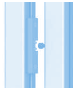
Türschnäpper (Set) Door Latch (Set)