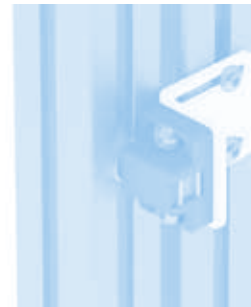
Befestigungswinkel für Kugelschnapper Angle Bracket for Ball Catch