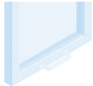
Frontwinkelgriff Front Handle