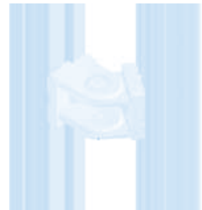
Gelenk 38 - 1,5" Pivot Joint 38 - 1.5"