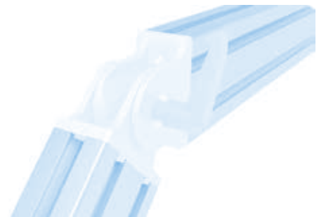
Gelenk 30 × 60 mit Klemmhebel Pivot Joint 30 × 60 with Locking Lever