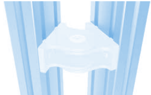
Gelenk 30 × 60 Pivot Joint 30 × 60