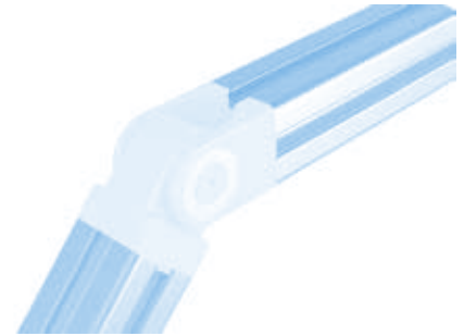
Gelenk B 20 Pivot Joint B 20