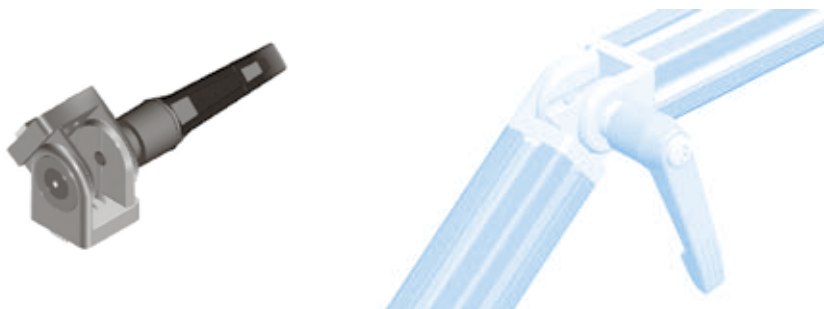
Gelenk 20 mit Klemmhebel Pivot Joint 20 with Locking Lever