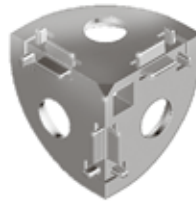
Eckwinkel 30 3-way Connection Angle 30