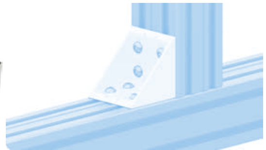
Winkel 80 flach Connection Angle 80 Flat