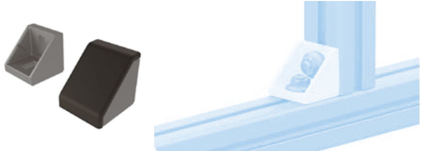
Aluwinkel 45 Alu Connection Angle 45