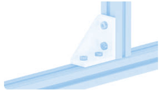
Aluwinkel 30/60 Alu Connection Angle 30/60