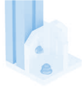
Fußkonsole Foot Console