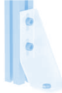
Bodenwinkel 160 Floor Bracket 160