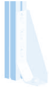
Bodenwinkel 200 Floor Bracket 200